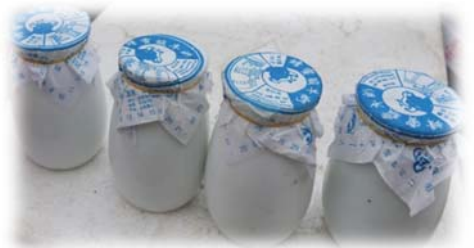
圖 11：北京酸奶，類似台灣優酪乳。喝完老闆會要回瓶子，帶走可是得多付錢呢！

從台灣到北京，一個海峽距離感覺很遙遠。但實際飛行距離 1696 公里，直航僅需約 3 個多小時。探索世界，體驗人生不需要太多準備，只需要大大的微笑和小小的勇氣，下一季歡樂人生的主角就會是你。