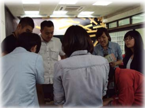
圖 6：招生說明會討論