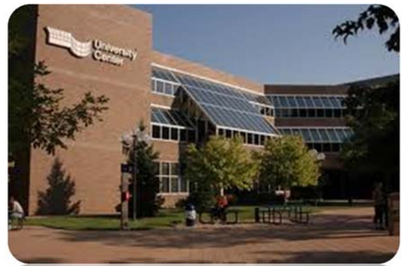
圖 8：University of Michigan- Flint

2013年，UM- Flint 管理學院與本院展開合作，以促進雙方的學術交流與互動。UM- Flint 內設有四大學院，包含管理學院、教育與人類服務學院、健康職業與研究學院以及藝術與科學學院，課程十分多元且豐富。此外 UM- Flint 也致力於提供學生良好的學習環境，透過小班制的教學來增進師生之間的互動、強調學生的個別化發展與實務經驗，讓學生的學習品質更好、效果更佳！