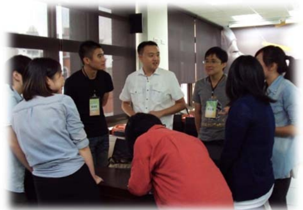
圖 7：招生說明會討論