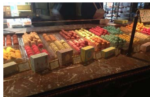
法國巴黎 LADUREE 馬卡龍