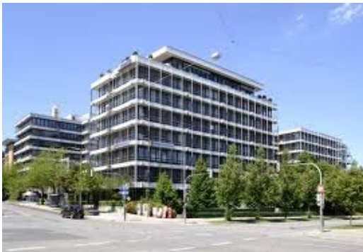
德國慕尼黑商學院

慕尼黑商學院除擁有三年的 International Business 學士課程、兩年的 International Business、Sport Business and Communication 碩士課程外，在 MBA 也有豐富的選項：International Management、General Management、Health Care Management。為了讓學生可以讓理論與實際結合，慕尼黑商學院更於每學期與公司、企業共同開課，不用擔心會有搶不到課的現象。